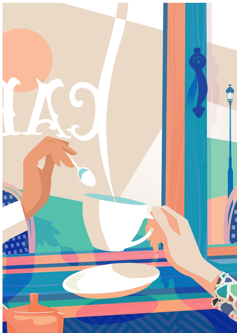
Illustration : Fabien Gilbert - 2021