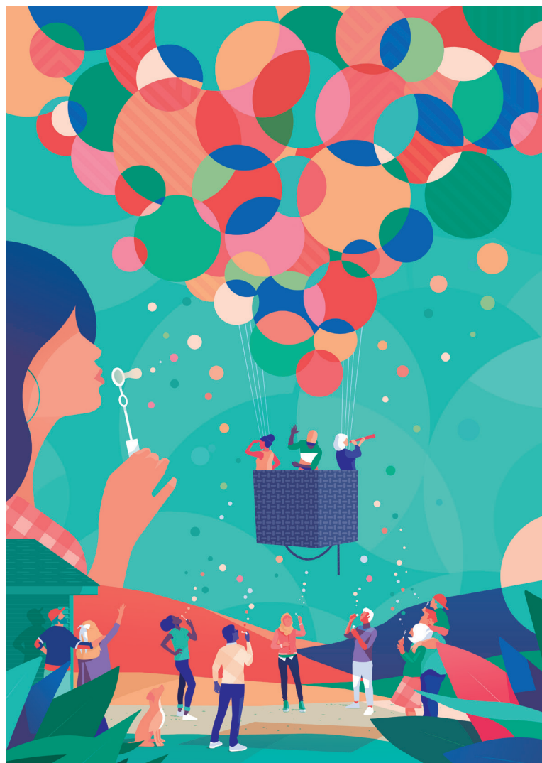
Illustration : Fabien Gilbert - 2021