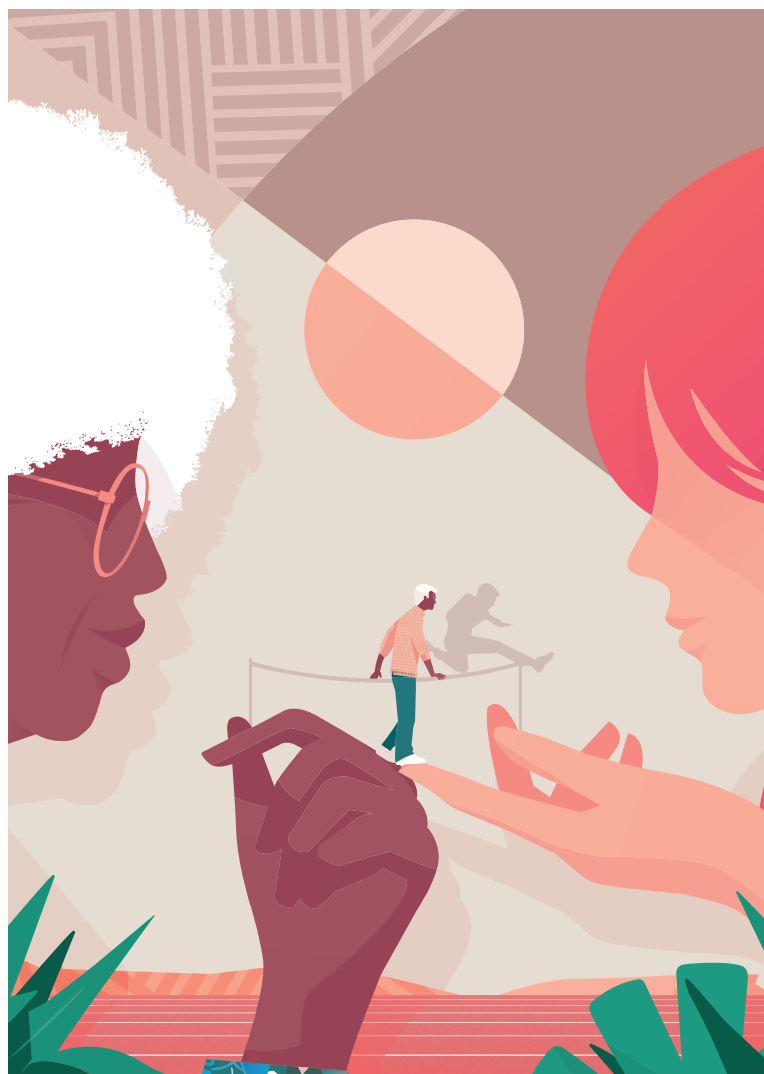
Illustration : Fabien Gilbert - 2021